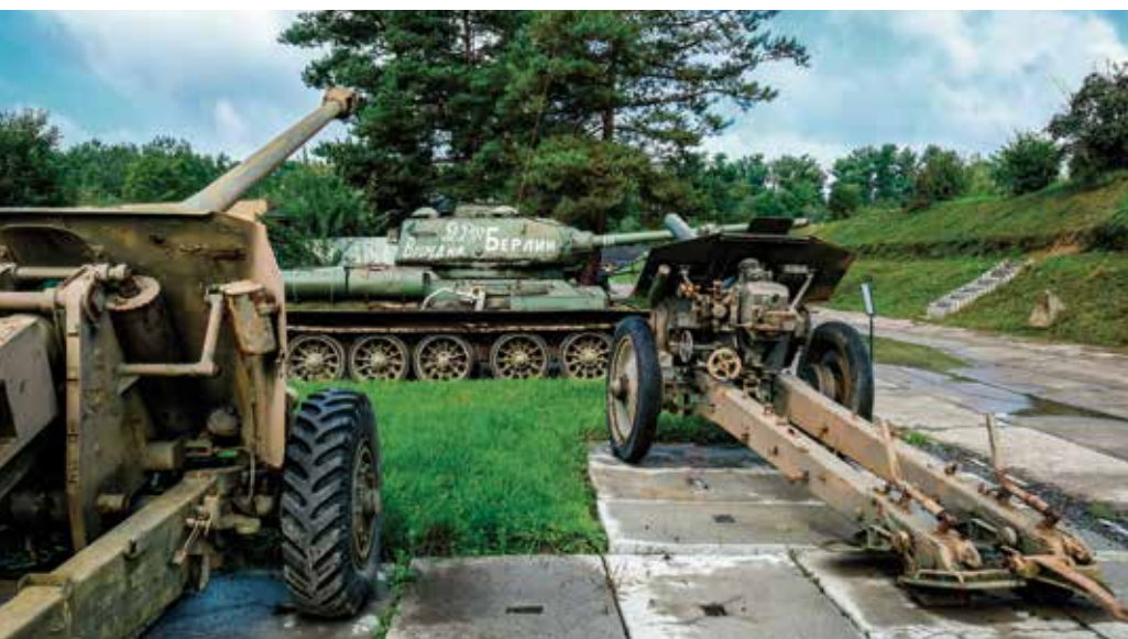
Muzeum na demarkační linii u Rokycan

Čímž se plynule dostáváme do rozlehlých vojenských prostorů, jež byly dříve veřejnosti zapovězeny; ale v posledních letech sem turisté a cyklisté mají vstup povolen, budou-li se držet vyznačených cest. Mimo ně stále hrozí nebezpečí, že šlápnete na nevybuchlou municí. Za doporučení rozhodně stojí návštěva Padrtských rybníků, které se nacházejí v nadmořské výšce téměř 650 metrů. Koupání je zde sice zakázáno, ale krása brdské krajiny je omračující.