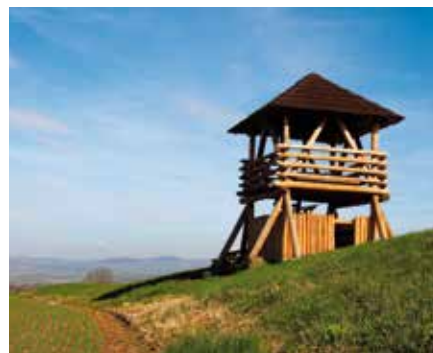
Keltské oppidum ve Stradonicích

Nesmíme zapomenout ani na další jeskyně v okolí. Cestou na Liteň potkáme třeba Zlomenou sluj. Kdysi v ní